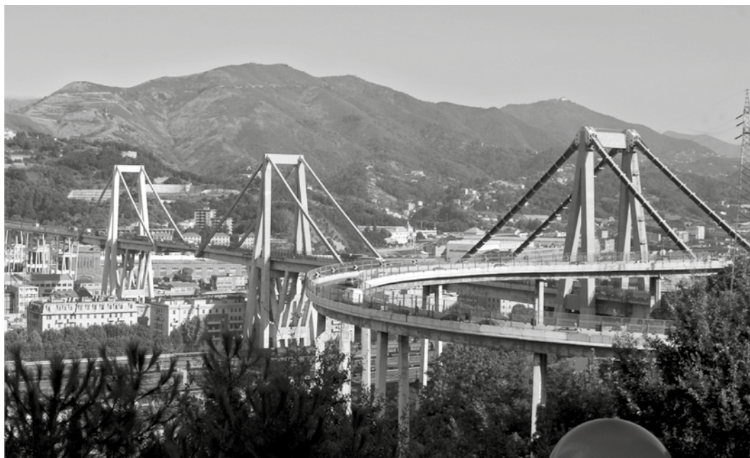
1. Vista del viadotto sul Polcevera.