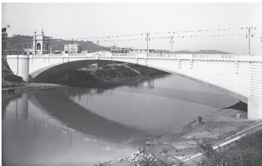
Fig. 7 - Il ponte del Risorgimento completato, fine 1911. Si noti G. Gatta Castello che saluta in basso a destra