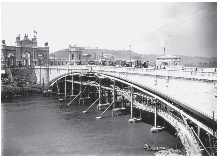
Fig. 6 - L'esecuzione della prova di carico con i rulli, a metà aprile del 1911. La centina in cemento armato è ancora in opera (ASPorcheddu)